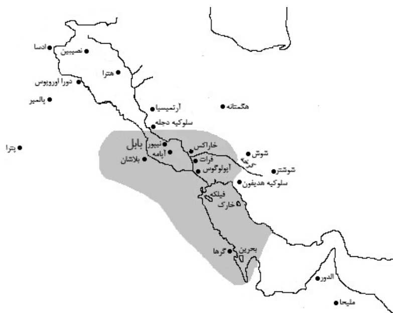
نقشه ۲. قلمرو پادشاهی خاراسن در اوج گسترش (نگارندگان).