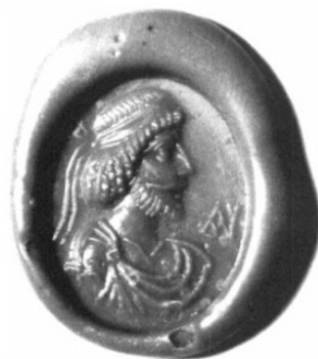
تصویر ۶. خارک، اثر یک مهر انگشتی با تصویر یکی از شاهان خاراسن. ۲