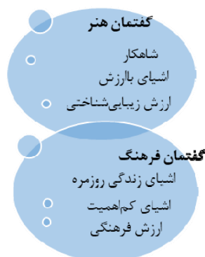
شکل ۲. رویارویی گفتمان هنر و گفتمان مواد فرهنگی در موزه‌های هنر اسلامی (نگارنده)

و مجسمه و در مرحله بعد بر «هنرهای فرعی» تری چون سرامیک، آثار فلزی یا شیشه تمرکز می‌کنند. در مقابل، موزه‌های «مواد فرهنگی» به نمایش «فرهنگ» بیش از «هنر» متمایل هستند. در این موزه‌ها به بافت شیء توجهی بیش از خود شیء نشان داده می‌شود. مواد فرهنگی دربرگیرنده مقولاتی چون «مذهب»، «جغرافیا» و مفاهیم فرهنگی چون «زندگی خانوادگی» هستند. ۱ گونلا با وجود نابرابری‌های توصیفی و طبقه‌بندی‌های سنتی هنر در قرن نوزدهم، عنوان «هنر» را برای آثار اسلامی موجود در موزه‌ها مناسب‌تر از «فرهنگ مادی» می‌داند. به عقیده او، طی صد سال گذشته پیشرفت‌های وسیعی در حوزه هنر اسلامی در سطح جهان ایجاد شده و موزه‌های هنر در مقایسه با فرهنگ مادی توانسته‌اند بستری منعطف‌تر و بدون جهت‌گیری برای پل زدن بر شکاف‌ها ایجاد کنند و افزون بر آن خوانش‌های متفاوت از آثار اسلامی را امکان‌پذیر سازند. امروزه با توجه به تغییر مداوم معنای هنر و درک ما از آن، کفایت تمرکز بر صورت و فرم آثار هنری و تکیه بر ارزش‌های جهان‌شمولی چون زیبایی و هارمونی در معرفی هنر اسلامی، از سوی پژوهشگرانی چون ترولنبرگ و وبر زیر سؤال رفته است. ۲