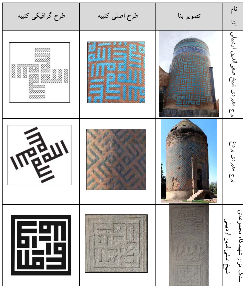
جدول ۲: کتیبه‌ی چهارگانه‌ی «الله» در برج مقبره‌های شیخ صفی‌الدین اردبیلی و بردع ۱