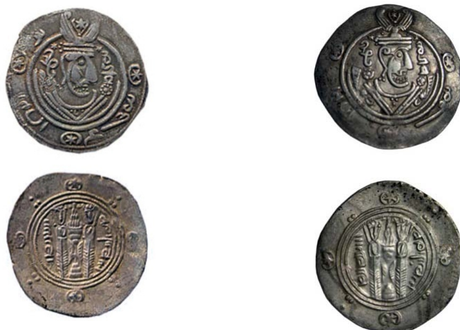
۱. سکه بی‌نام، آستان قدس، س ۲۹ر۴۴ ۲. سکه بی‌نام، موزه پول بنیاد، ۴۹۳۴۷-م