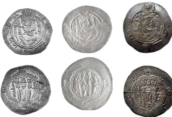
۳. معد، بانک سپه، ۱۰۶۷۷. ۴. مقاتل، آستان قدس، س ۴۲۲۹. ۵. قُدید، Malek, 2004: 124, 137.2.